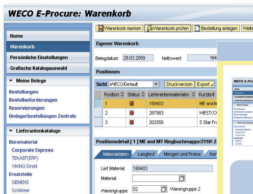
WECO E-Procure Beispiel und Ablauf

Hier erfahren Sie mehr zu dieser und zu weiteren Lösungen aus unserem Hause. Gerne beraten wir Sie auch in einem persönlichen Gespräch über die Einsatzmöglichkeiten von WECO E-Procure in Ihrem Unternehmen.